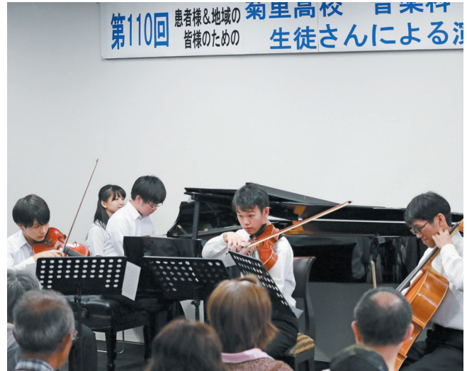
宇野病院でのコンサート