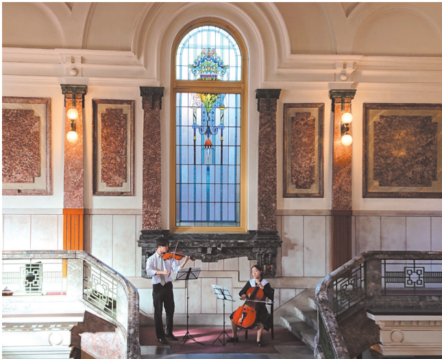
市政資料館オータムコンサート