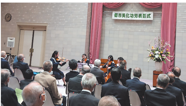
都市美化功労表彰式典での演奏