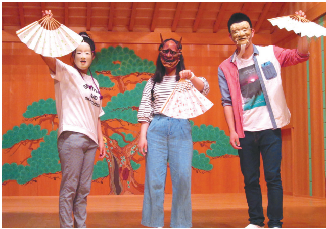
稲武野外研修（豊田市能楽堂）